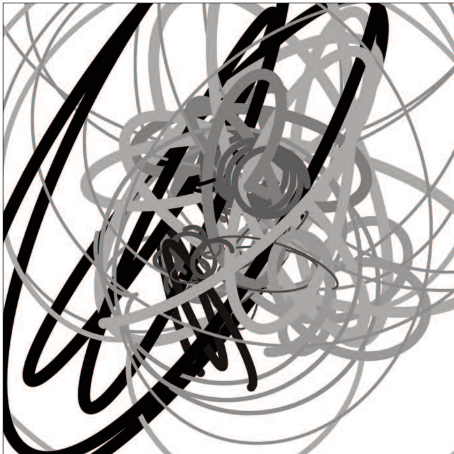
Kroužení BW-16-05-05 , 2016, digitální tisk, polyesterové plátno, 90 x 90 cm

Zcela nový typ strojů – počítače – se od svého vynalezení postupně prosadily ve vědě, výrobě i každodenním životě. Jak dopadl průnik umění a počítačové technologie? Kromě bohatě rozvinuté praxe okamžité manuální manipulace digitalizovaných souborů se trvale rozvíjí i linie, která se snaží využít počítače pro posílení samotného tvůrčího procesu. Jednou z cest je počítačové generativní umění, kterému se bude přednáška věnovat obecně a na příkladech tří vybraných autorových cyklů také konkrétně.