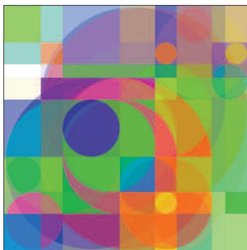
XT_Ch7_C&C-H0038 , 2014, digitální tisk, papír, smart, 50 x 50 cm