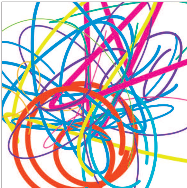
Kroužení BC-16-05-10 , 2016, digitální tisk, polyesterové plátno, 90 x 90 cm