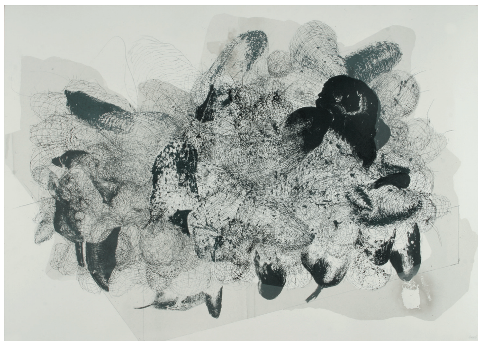
Molekula papíry, 2003, síťotisk, 700 x 1000 mm